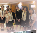
參觀香港假日酒店